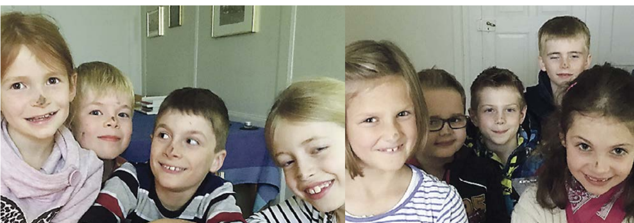
Bild rechts: Einstiegslager 7. Klasse mit KG Zimmerwald Bild unten: Kennenlern-Nachmittag 1. Klasse

In der Oberstufe arbeiten wir weiterhin erfolgreich hauptsächlich mit der Kirchgemeinde Zimmerwald zusammen. Das 7. Klass-Einstiegslager im Mai haben wir bereits hinter uns, im Herbst werden wir in der 8. Klasse weiterfahren und mit der 9. Klasse dann mit dem Konflager in Magliaso (26. bis 29.10.2016) ins Konfjahr starten.